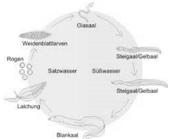
Lebenszyklus und Fortpflanzung des europäischen Aals

Bitte beachtet immer die Homepage des Vereins unsere Facebook Präsenz und unsere Infomedien Email Jetstream und WhatsApp Quelltext